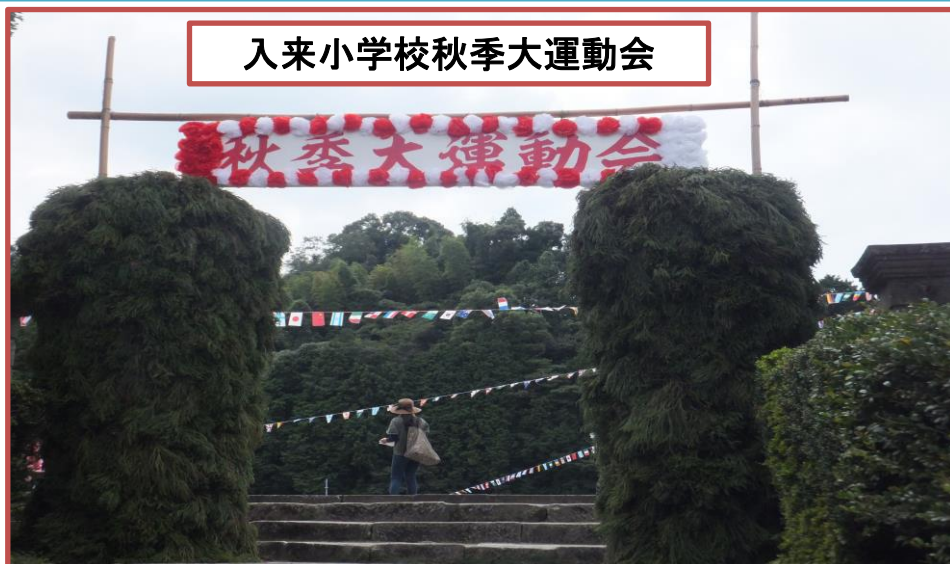
昔なつかし 杉の門です