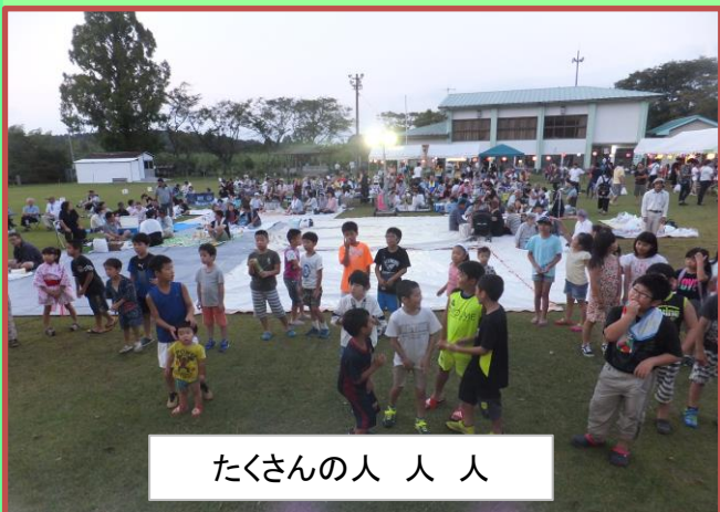
たくさんの人 人 人