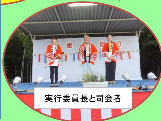
実行委員長と司会者