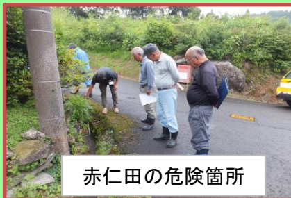
赤仁田の危険箇所

入来支所から3名と各自治会長さん、コミの会長、主事で災害危険箇所を見て回りました。4自治会から該当箇所が出ていましたので現地を確認して検討会が行われました。緊急性のあるもの、年次的なものとの振り分けがありました。順次、解決へつながっていくものと思われます。