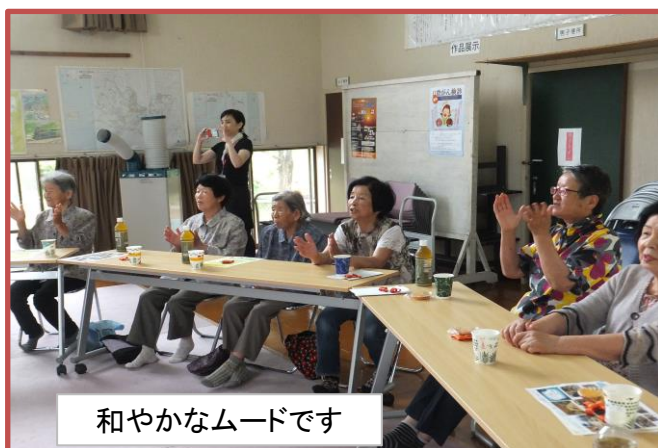
和やかなムードです