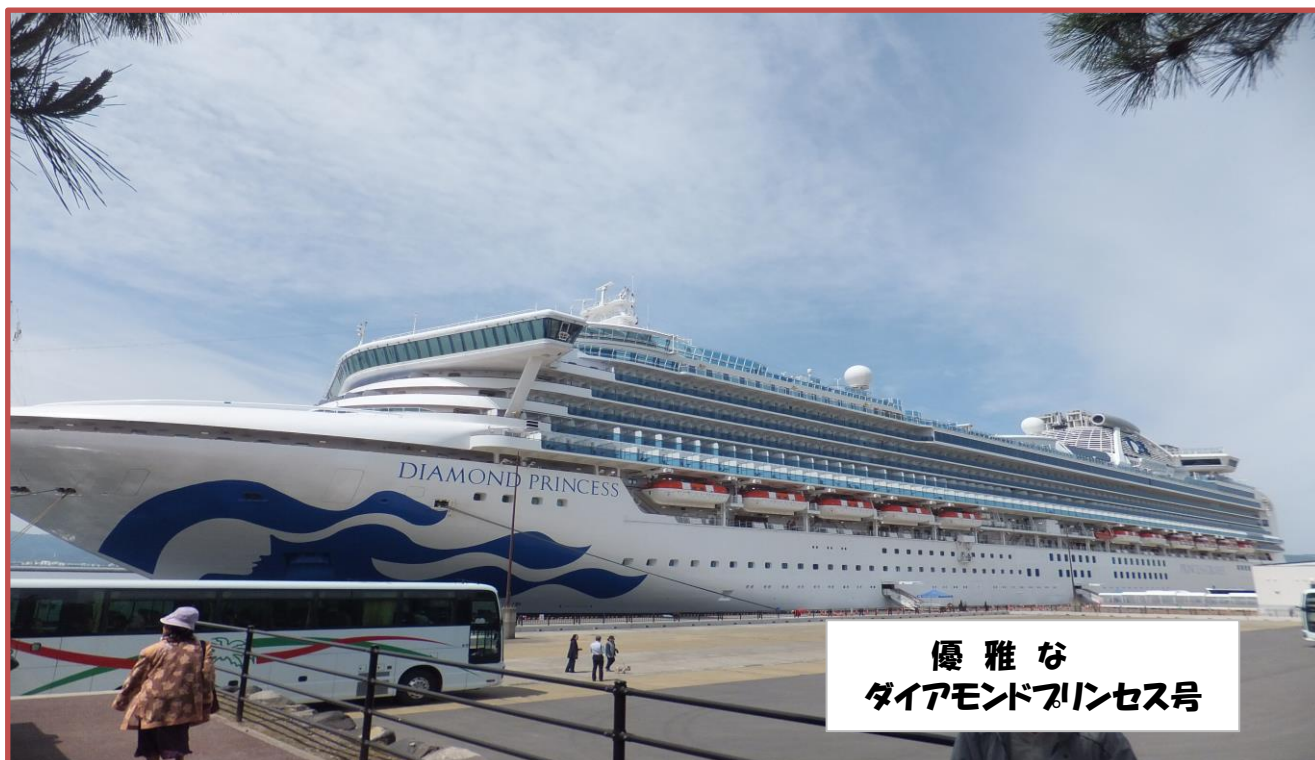
優雅な ダイヤモンドプリンセス号