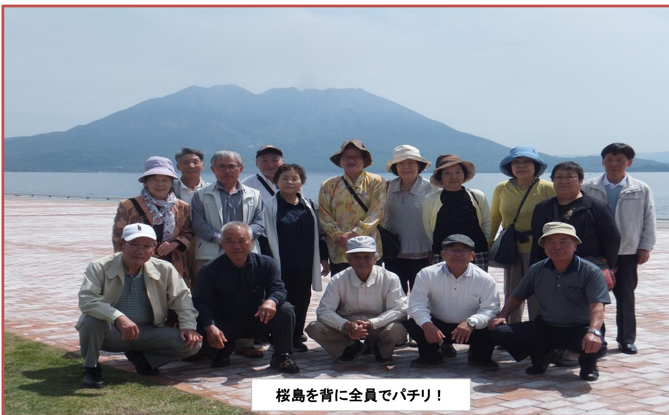
桜島を背に全員でパチリ！

5月8日(水)福寿会で鹿児島市のマリナーポートへ社協からのバスをお借りしてイギリスの豪華客船「ダイヤモンドプリンセス号」を見学に行きました。