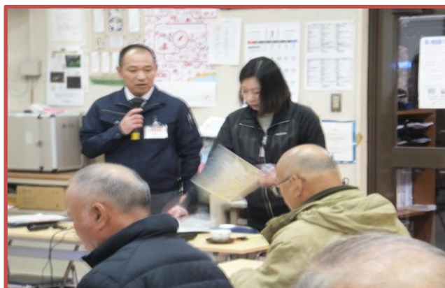
防災安全課の説明

2月9日に鹿児島県原子力防災訓練に伴う説明会です。八重地域は川内原子力発電所から23, 3km離れているので屋内退避となります。ご協力ありがとうございました。