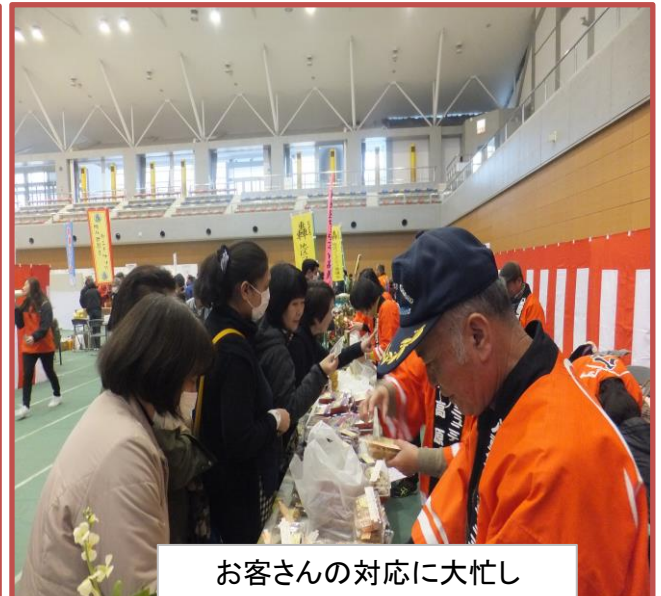
お客さんの対応に大忙し

2月17日(日)コミュニティブランド市が開催されました。八重コミュニティ協議会から竹林同好会の方々が参加しました。毎年のことですがご苦労様です。