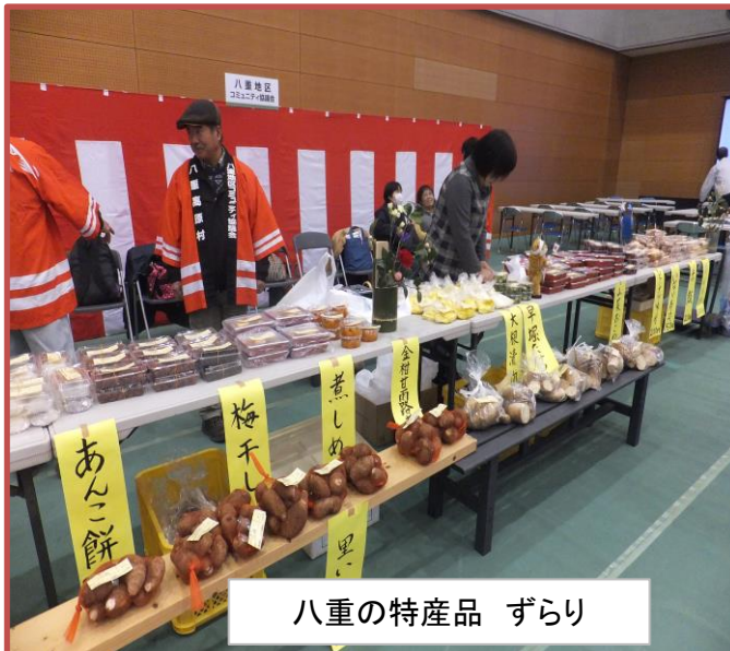
八重の特産品 ずらり