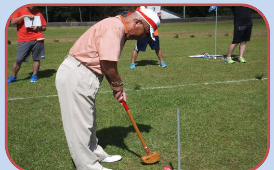
思ったごといかなな～