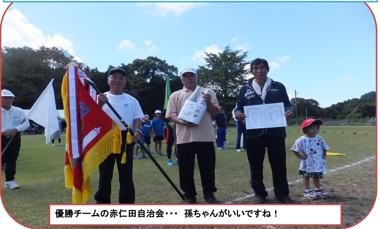
優勝チームの赤仁田自治会… 孫ちゃんがいいですね！

今年の70歳以上の敬老者は35名ですが運動会には31名の参加があり八重の先輩たちのお元気の証です。コミュニティ協議会からお祝いの弁当とお茶が配布されました。高齢者から幼児まで皆さんが一同に集まり、競技を通じてたくさんの笑いや感動が生まれたことは間違いありません。来年はどうかと危惧する声もありますが皆さんの楽しそうな笑顔や笑い声などを聞くと、もう少しやれるところまでやってみたらどうでしょうか……と私は感じました。皆さん暑い中、お疲れさまでした！