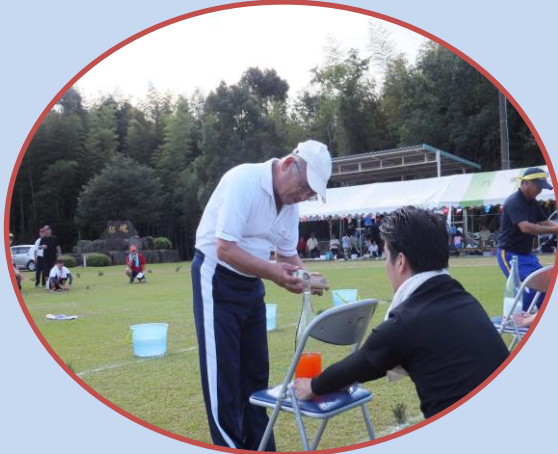
会長・ガンバレー