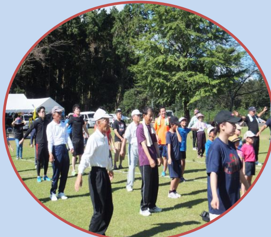
準備運動はしっかり