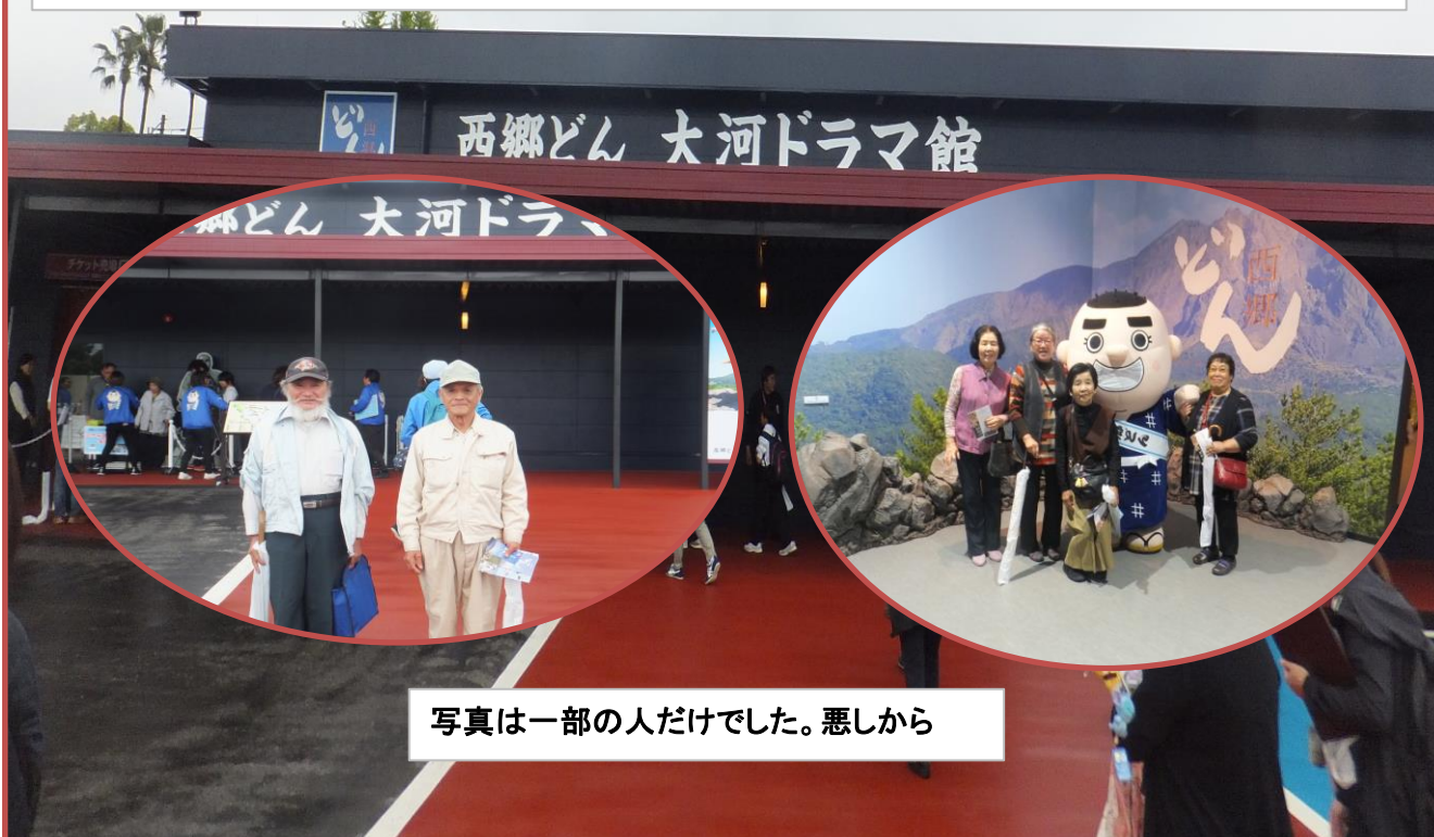
写真は一部の人だけでした。悪しから

福寿会では5月2日、第2回のサロンで鹿児島市の維新ふるさと館と西郷どん大河ドラマ館に行きました。あいにくの雨でしたがバスの乗り降りには雨もやんでくれ、助かりました。昼食は県庁の1階にある食堂で幕の内弁当を食べました。社協のバスと運転手さん、社協職員の添乗員とお世話になりました。ありがとうございました。