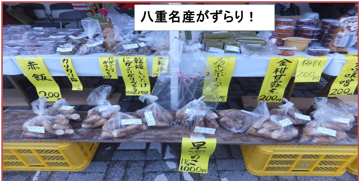
八重名産がずらり！

2月18日(日)薩摩川内市主催の生涯学習フェスティバルの中でコミュニティブランド市に八重地区コミュニティ協議会(竹林同好会)が参加しました。穏やかな日に恵まれ、たくさんの品々を並べました。早堀たけのこを目当ての方は開店前から並んで買って頂き、店頭で並んでいた品物は午前中で完売しました。前日からたけのこ堀やそれぞれの出店品の準備など大変でしたがその甲斐がありました。竹林同好会の皆さんありがとうございました。