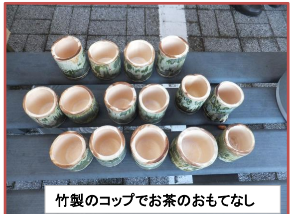
竹製のコップでお茶のおもてなし