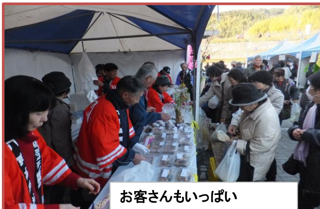
お客さんもいっぱい