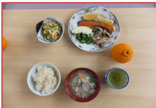
出来上がりはこの通りです

2月21日のひまわり茶房は21名が参加し食改の料理教室を行いました。男性も交じてエプロン姿で頑張っていました。今回のメニューは雑穀ごはん、鮭のムニエル、キャベツのピーナツからし和え、味噌けんちん汁でした。日頃の自宅の味と比べながら味わいました。物足りなく感じる方もおられたようですが体のことを考えるとこのくらいの味でいいんだと理解しました。せっかく学びましたので自宅でも薄味を取り入れてみましょう！