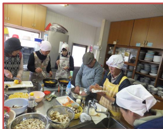
エプロン姿もばっちりです