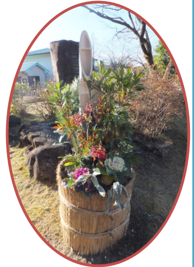
コミュニティ入口の門松