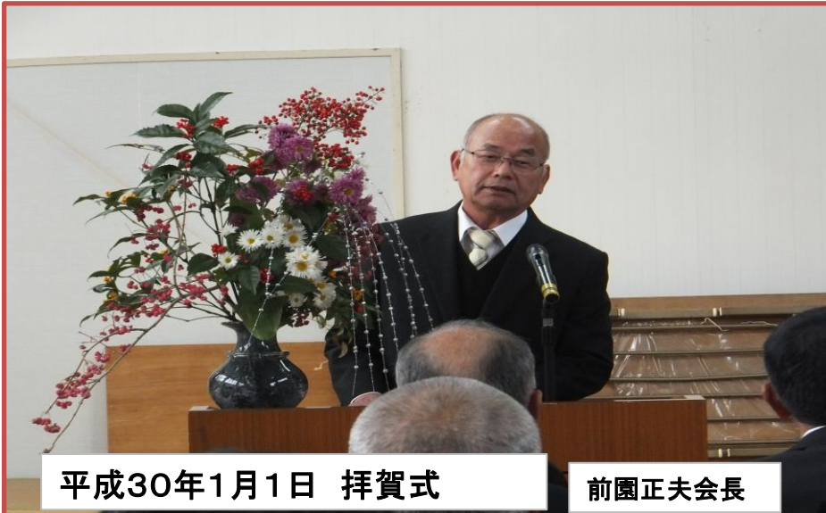
平成30年1月1日 拝賀式