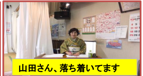
山田さん、落ち着いています