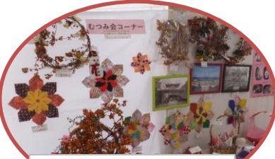
むつみ会コーナー