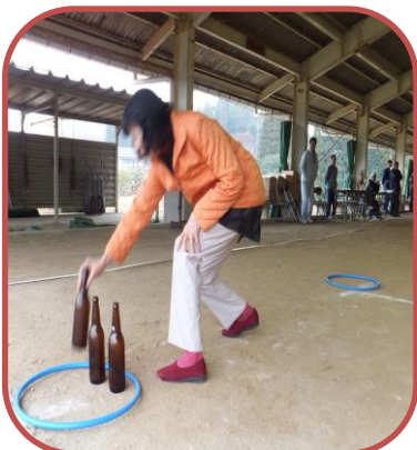
ビン不倒さないように

11月26日(日)あいにくの雨の中、入来地域体育大会が入来体育館下のゲートボール場で開催されました。スプーンリレーに始まり、ねらいを定めて、輪投げ、最後は置き換え競争と4種目中3種目が1位となり、優勝に結びつきました。練習もしたのでみんなばっちりできました。お昼の弁当でささやかな祝勝会となりました。おめでとうございます。お疲れさまでした！