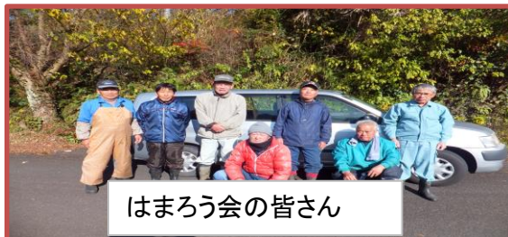
はまろう会の皆さん

12月13日（水）はまろう会の皆さんが高原広場の草刈りをされました。つつじ・桜・もみじ・紫陽花など折々の花を咲かせてくれます。管理は大変ですが通行人の目を楽しませてくれます！