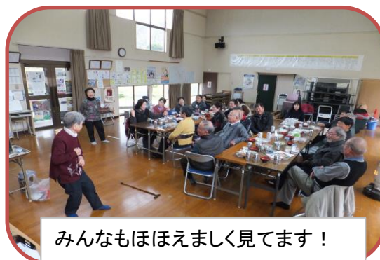
みんなもほほえましく見えます！