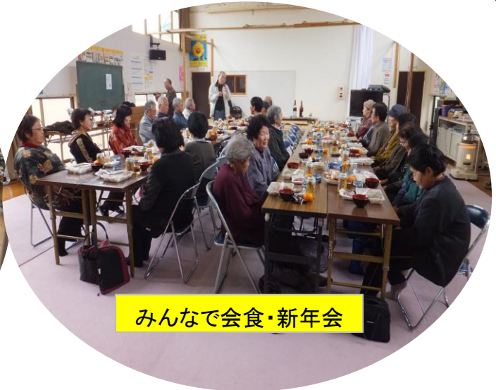
みんなで会食・新年会