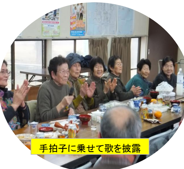
手拍子に乗せて歌を披露

1月29日(日) 27名の方が参加され、第6回ふれあいサロンが実施されました。全員の血圧測定の間には、ストーブを囲んで、男性グループ・女性グループの輪が出来、それぞれ話が弾んでいるようでした。ラジオ体操の後、文化祭の練習。本番への意気込みが、感じ取れました。その後、婦人会員手作りのお弁当を食べながら、新年会が行なわれました。カラオケも披露され、皆さん楽しそうに手拍子されていました。