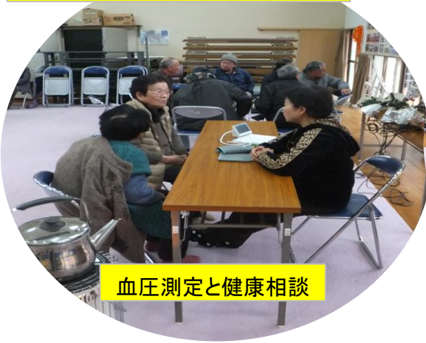
血圧測定と健康相談