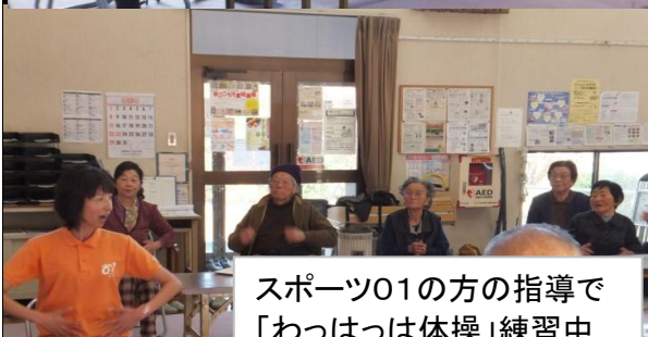
スポーツ01の方の指導で「わっはっは体操」練習中