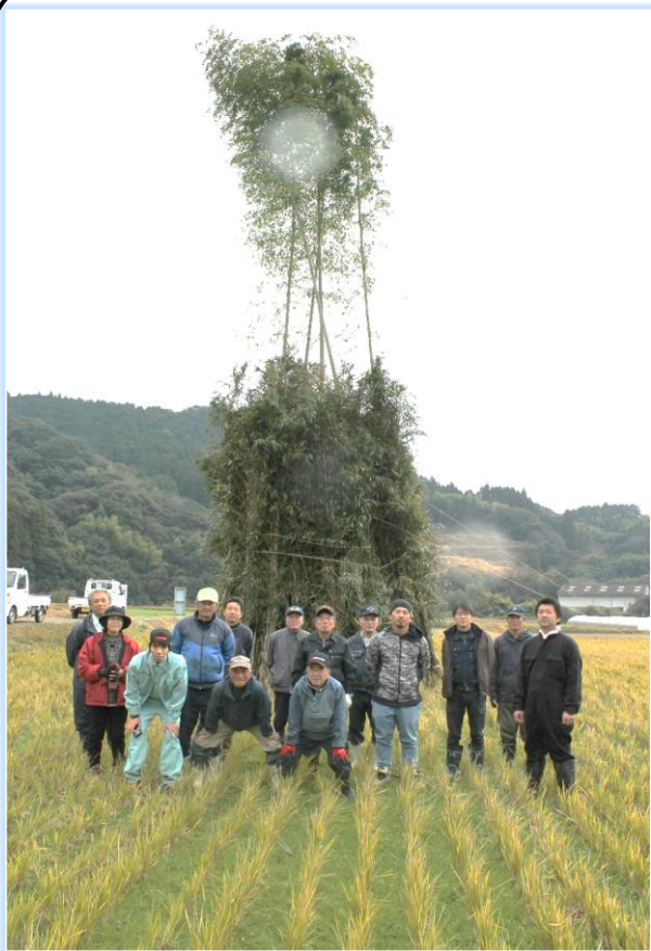
年末の強風により倒れた