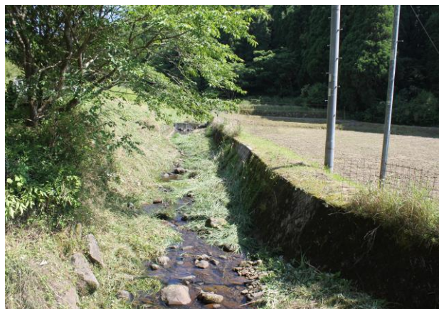
日の出自治会川岸の作業終了後