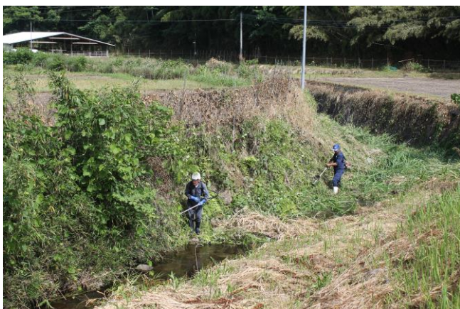
日の出自治会川岸の草払い作業