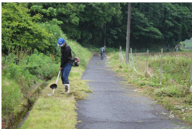
平木場自治会の道路草払い作業