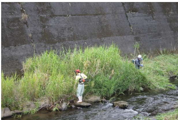
平木場橋上流の川岸の草払い作業