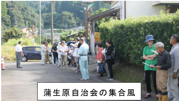
蒲生原自治会の集合風景

朝陽地区総合防災訓練が実施されました。避難訓練開始の放送でそれぞれ自治会指定の避難場所へ集合、避難者の確認等がありました。その後コミセンで薩摩川内市防災安全課の職員による「土砂災害等についての備え」の説明会がありました。朝陽地区のほとんどが「土砂災害特別警戒区域と警戒区域」に入り、がけ崩れ等の恐れがあります。避難する時に非常時の飲料水・非常食など「緊急避難セット」を準備することの話もありました。災害はいつ、どこで発生するかわかりません。避難する時は自治会で指定された集合場所へ、隣近所声をかけて集合しましょう。