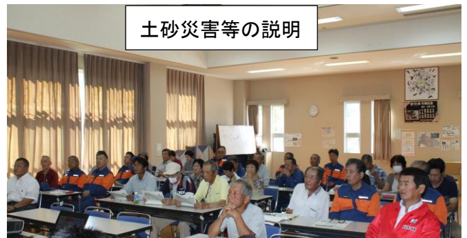
土砂災害等の説明