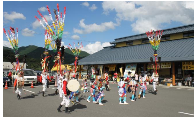
おじゃったモールさつま川内館