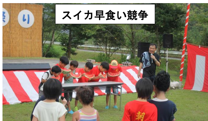
スイカ早食い競争