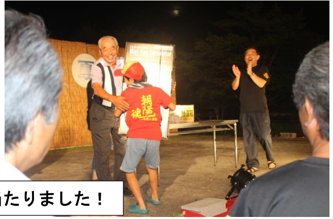
豪華賞品が当たりました！