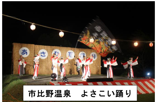
市比野温泉 よさこい踊り