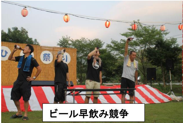
ビール早飲み競争