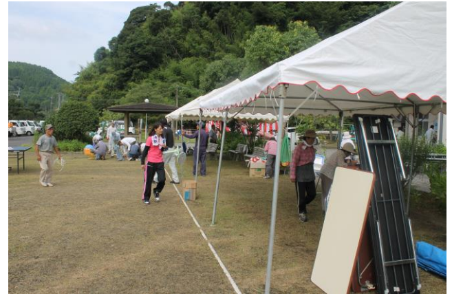
翌日の後片付けです。担当の自治会・地域づくり部会の皆さんお疲れさまでした。