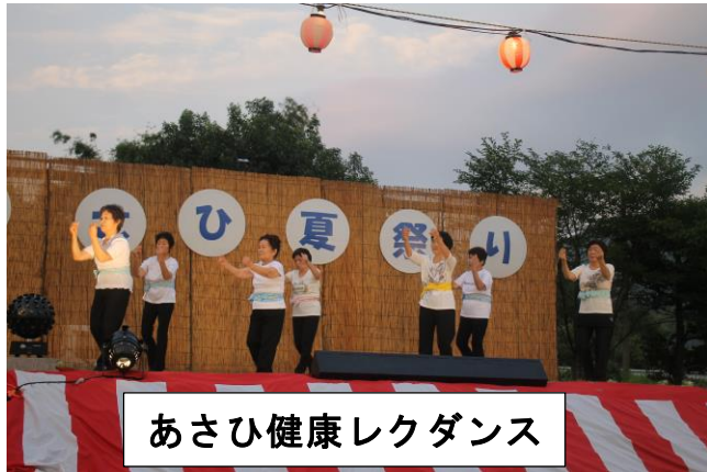
あさひ健康レクダンス