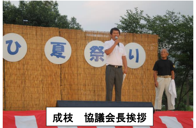
成枝 協議会長挨拶