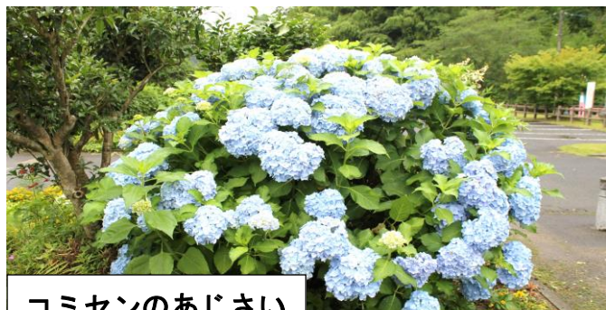
コミセンのあじさい

梅雨に入り日曜日の午前7時から実施されました。今月の当番自治会は堂園・天貴美自治会の皆さんが25名参加されました。夏草の成長は早く、花壇・ゲートボール場・周囲を刈り取ってもらい、8時20分ごろまでの作業で終了。お陰様できれいになりました。