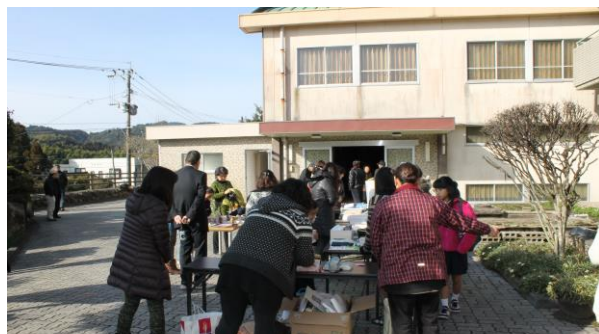
平成25年度のスナップ写真です。