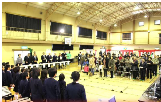
平成25年度のスナップ写真です。

小学生による演奏・合唱、地区内の皆さんの踊り・演技や展示コーナーが予定されています。皆様のご来場をお待ちしています。