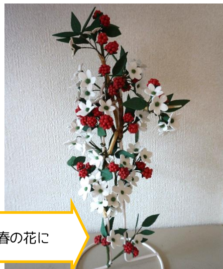
冬の花から春の花に