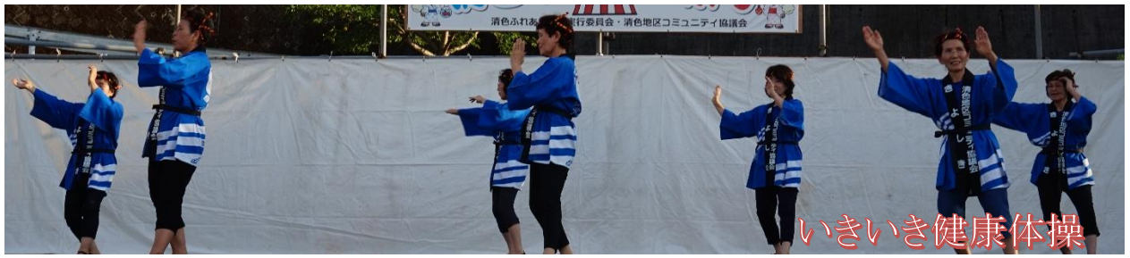
いきいき健康体操