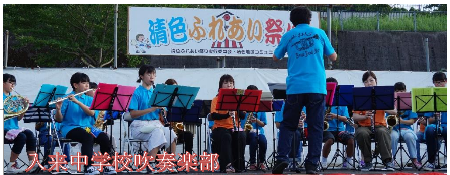
入来中学校吹奏楽部