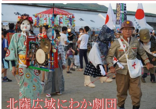
北薩広域にわか劇団