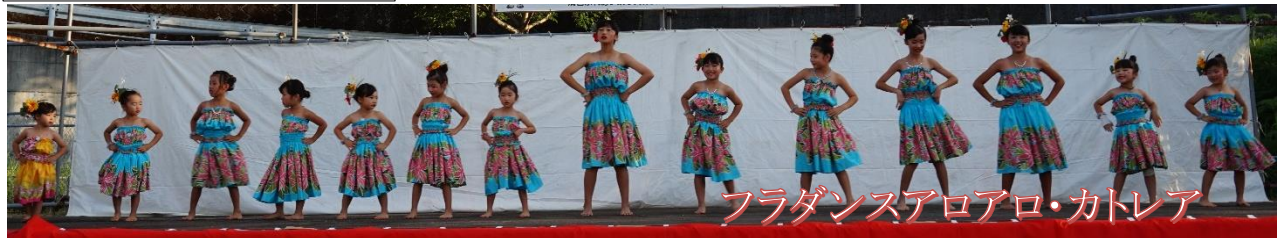
フラダンスアロアロ・カトレア