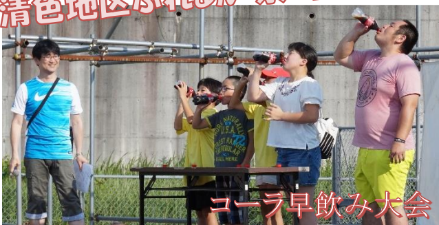
コーラ早飲み大会

7/15（土）青空の下、松清園グラウンドにて清色ふれあい祭りが開催されました。オープニングとしてお神輿が登場！地区の子供たちと一緒に会場を練り歩きました。テントでは、高校生クラブ・清色サッカー・隆盛・和 sweet はりま屋・いりきは一つ・日ノ丸交差店が出店されました。