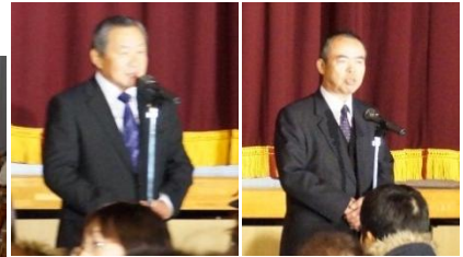
上野議員・東郷支所長よりご挨拶をいただきました。