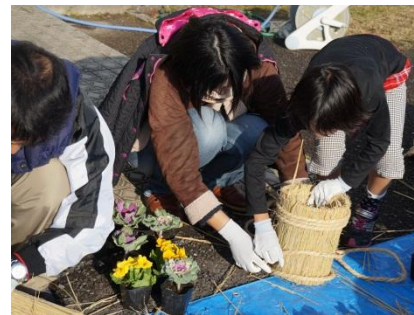
ミニ門松製作中。子ども達ものごきりで竹切りの作業を頑張りました。

老人会・部員の皆さんにお手伝いをいただいて、コミセンの門松を製作しました。こんなに立派な門松が出来ました! → 協力いただいた皆様ありがとうございました。