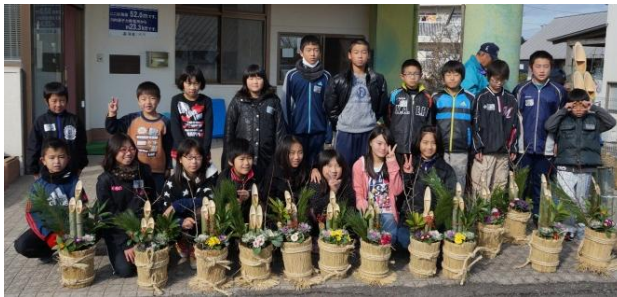
完成した門松と一緒に「はいチーズ(^)v」