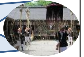
県指定無形民俗文化財「奴踊り」