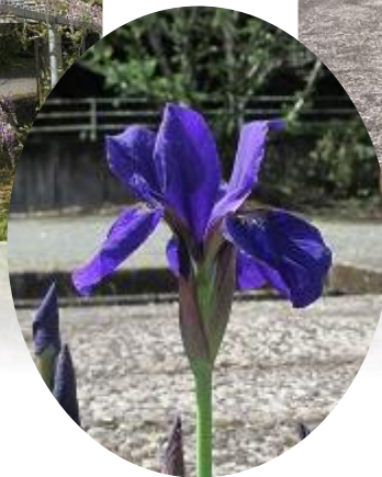
旧倉野小学校、藤の花!!