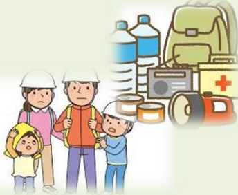
防災グッズも忘れないように!!