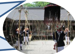
県指定無形民俗文化財「奴踊り」