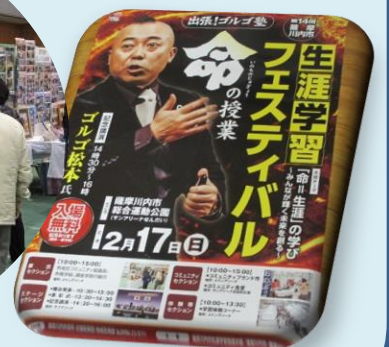
薩摩川内市 サンアリーナに於いて