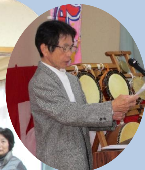
メッセージの紹介