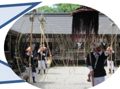
県指定無形民俗文化財「奴踊り」