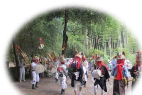
2013年 太鼓踊りの様子