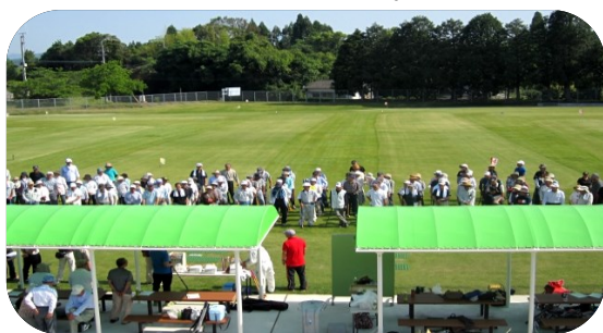
◆◆◆一昨年の大会の様子◆◆◆