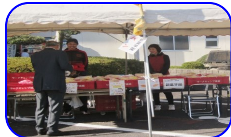
新葉学園さんのパン♪