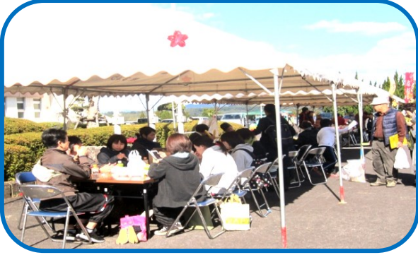
食堂コーナー 皆さんの美味しそうな顔。

うどん・おにぎり販売 今年はおにぎりセットで販売 しました。部員の方々、早朝からの準備 お疲れ様でした。美味しかったです！！