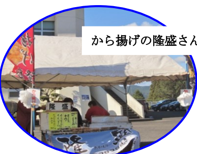
から揚げの隆盛さん