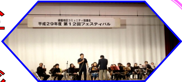
素晴らしい演奏に感動！ 川内市民楽団の皆さん