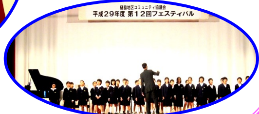
奇跡が起こった！ 樋脇小合唱団