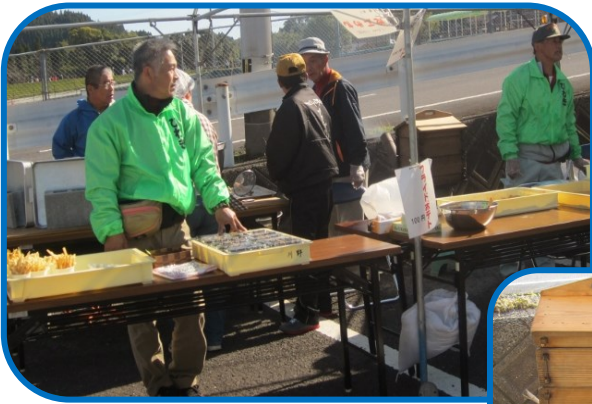
早朝から準備、つきたての 餅で心を込めて作りました。 最高に美味しかったです♪