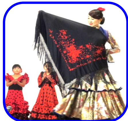
華麗な舞い ルナフィエスタの皆さん