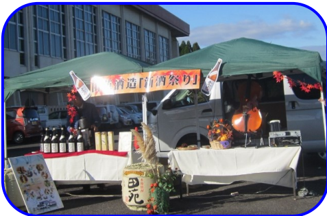
田苑酒造さんの新酒祭り