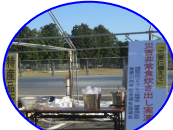
社会福祉協議会さん