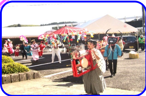
オープニングは賑やかに！ ちんどん屋さん！！