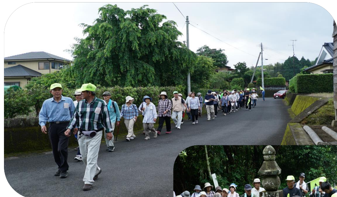
さあ、車に気をつけて出発！

5月31日(日)、4年ぶりとなる「ぶらり散策ひわき」を実施しました。当日は心配した天候にも恵まれ、たくさんの方々にご参加いただきました。58名参加。