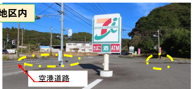
空港道路沿い(セブンイレブン市比野店)