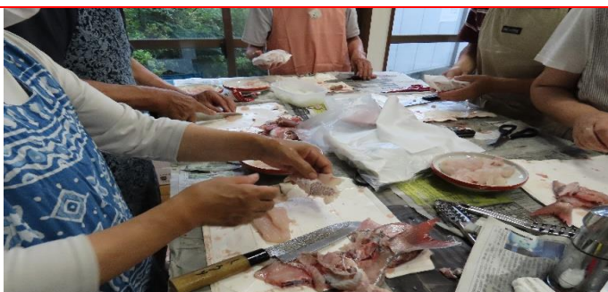
先ほど、お手本を見てから時間が経過。覚えているかな？二組目の参加者たちです。