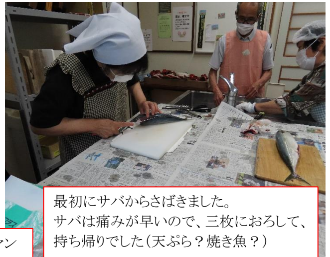
最初にサバからさばきました。サバは痛みが早いので、三枚におろして、持ち帰りでした(天ぷら？焼き魚？)