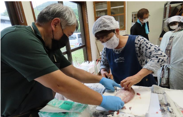
鯛はひれや骨が固いので漁業協同組合の方にマンツーマン指導を受けました。鯛は刺身にして試食をしました。

三枚おろしに活躍する講師の包丁が、とっても気になり、話題になりました。みんな買い求めたかな？ほしい方は、コミセンまでお尋ねください。特別に教えますよ(*~*)