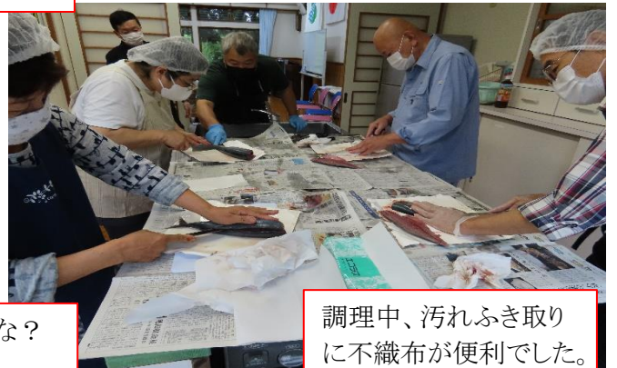
調理中、汚れふき取りに不織布が便利でした。