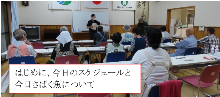
はじめに、今日のスケジュールと今日さばく魚について