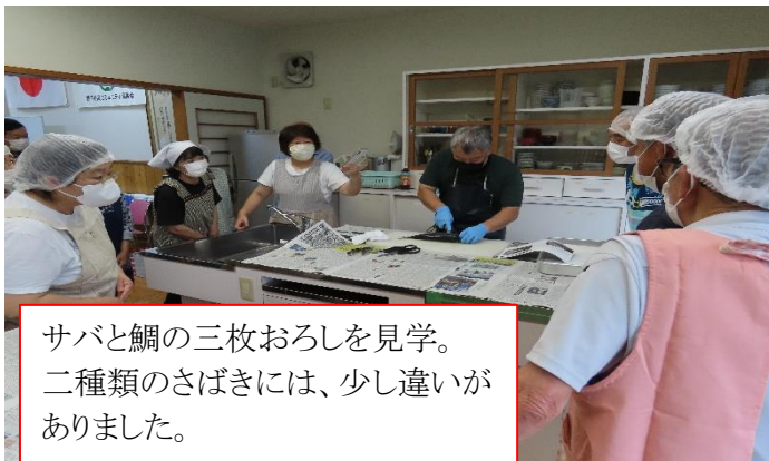
サバと鯛の三枚おろしを見学。二種類のさばきには、少し違いがありました。

薩摩川内市の耕地林務水産課と漁業協同組合の方々の協力をいただき、今回の教室ではサバと鯛を包丁でさばきました。