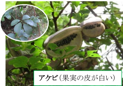
アケビ(果実の皮が白い)

ムベとアケビ 葉、果実で区別ができます。4～5月に咲く花にも違いがあるようです。野下の市道、県道沿いに生育しています。