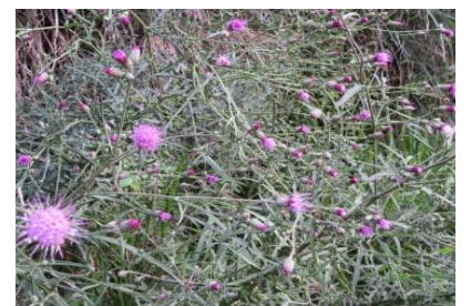
ヒメヤマアザミ(キク科) 高さ1～2mの多年草 白花は少ないです 市道藤本野下線で今、見られます。