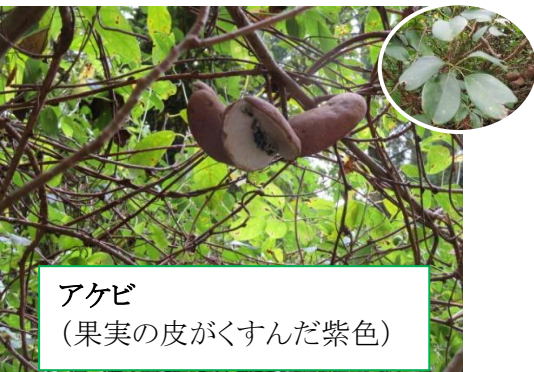
アケビ (果実の皮がくすんだ紫色)