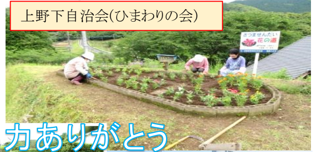
上野下自治会(ひまわりの会)