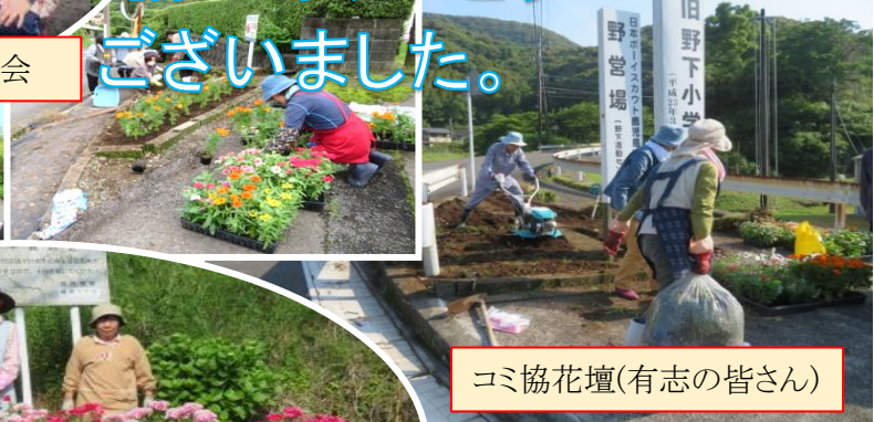
コミ協花壇(有志の皆さん)