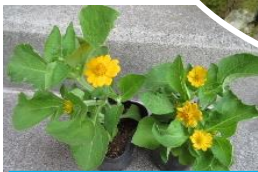
メランポジュウム