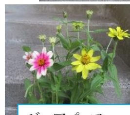
ジニアプロフェーション