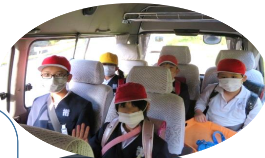
藤本地区6名のお友達と一緒にです。