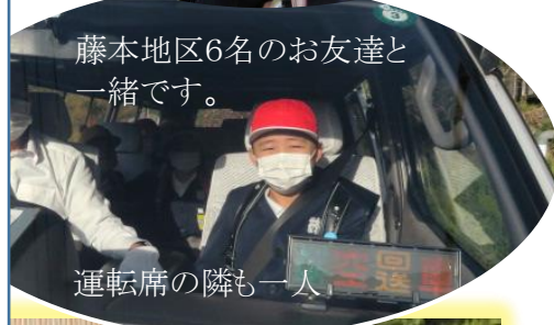
運転席の隣も一人！