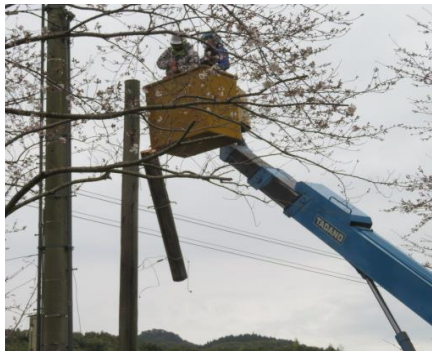
柱は分割して切断