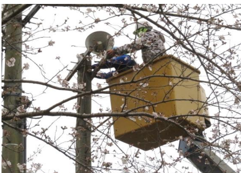
残ってたスピーカーの撤去

昨年8月27日午前、スピーカー1個の落下を確認。使われていない学校放送のスピーカー3個のうちの1個が腐食して落下したのもでした。9月2日、3日は本庁、地域政策課、財産活用推進課と業者で現場確認、見積。今月、23日の工事にいたりしました。撤去する柱の周りに光ファイバー網があったため、慎重さと正確さが求められる作業でした。