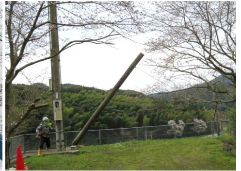
安全な長さで切断