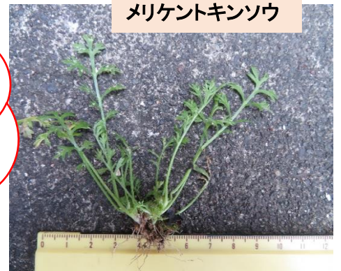
メリケントキンソウ