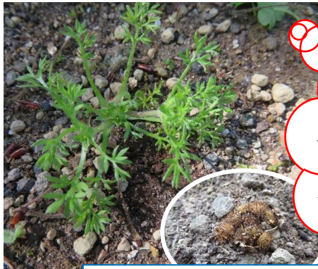
種子を残し葉は枯れます。

草丈は5~10cmで、 種子には2mmほどの鋭いとげが あり、肌などに刺さりケガなどを する恐れがあります。