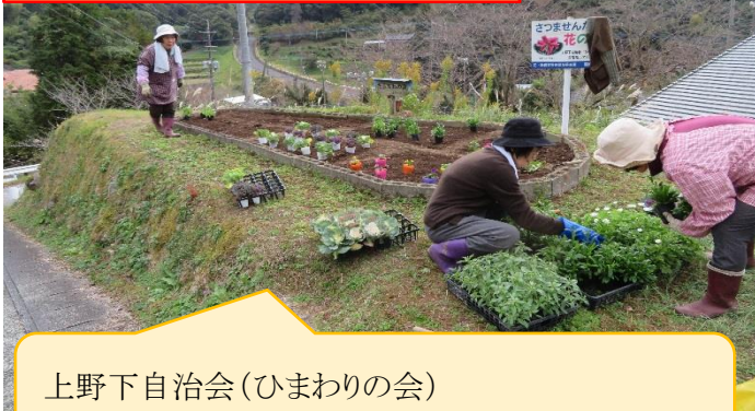
上野下自治会(ひまわりの会) お空の雨雲を気にしながらの作業でした(・)