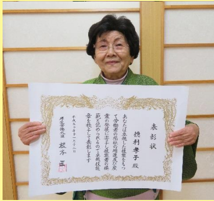
孝子さん(今年米寿を迎えられました)