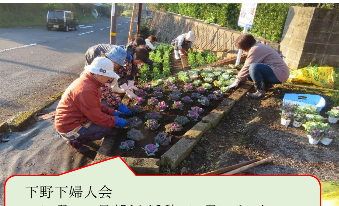
下野下婦人会 日曜日の早朝より活動。日曜日はスケ ジュールが目いっぱい詰まってそう ^^*/