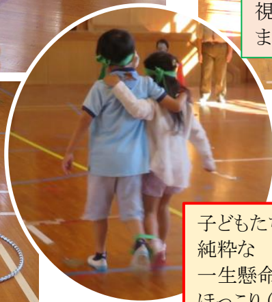
子どもたちの 純粋な 一生懸命さに ほっこり(^o^)