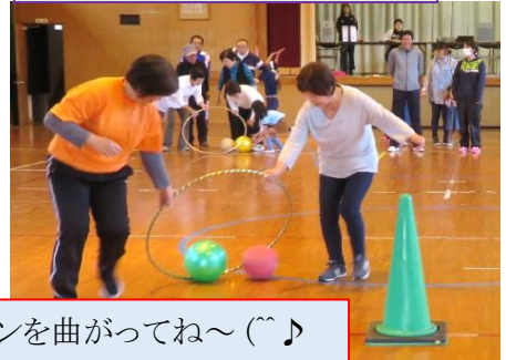
コーンを曲がってね~(^_^)