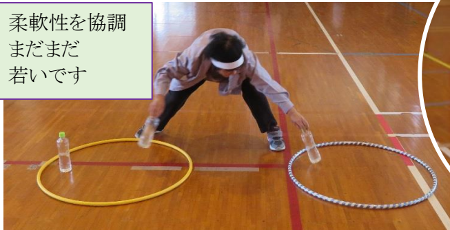
柔軟性を協調 まだまだ 若いです