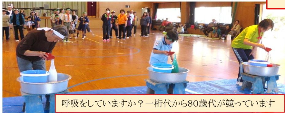
呼吸をしていますか？一桁代から80歳代が競っています