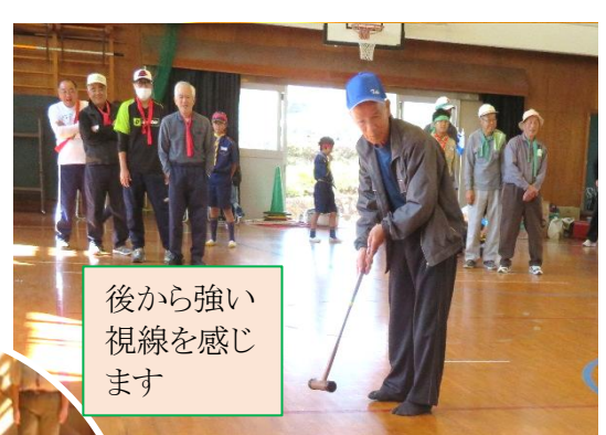
後から強い 視線を感じ ます