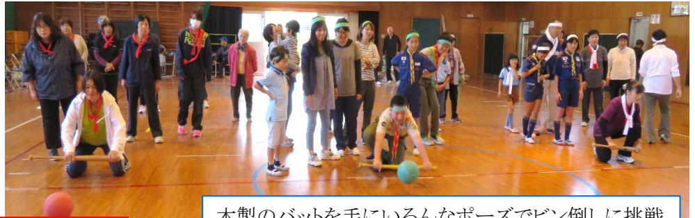
木製のバットを手にいろんなポーズでビン倒しに挑戦