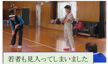
若者も見入ってしまいました