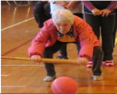
ひざも着かず安定したこの姿勢が85歳(^_^)