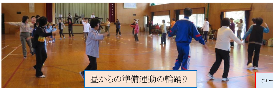
昼からの準備運動の輪踊り