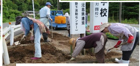
コミュニティ協議会管理の花壇