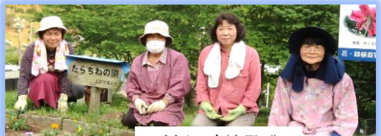
ひまわりの会(上野下)