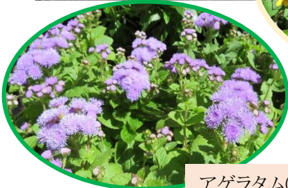
アゲラタム(花は紫色)