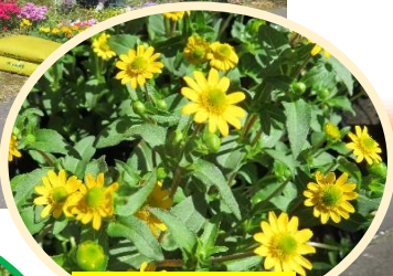
サンビタリア (花は黄色)