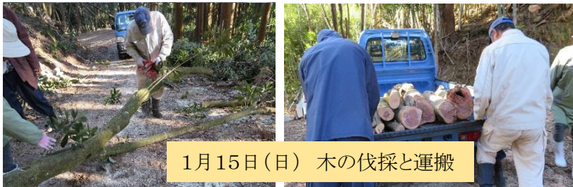
1月15日(日) 木の伐採と運搬