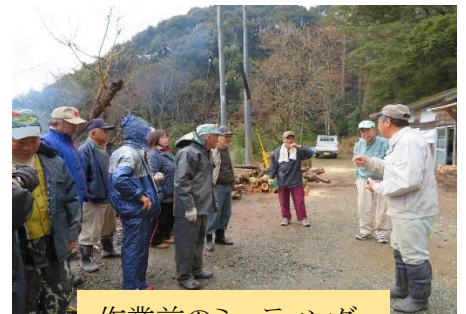
作業前のミーティング