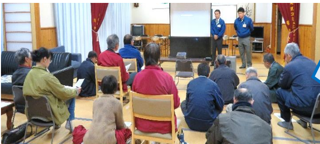
薩摩川内市防災安全課によるH28年度原子力防災訓練に係る説明会に、自治会長、防災サポーター、消防副団長他10名が参加。(H28年12月21日)