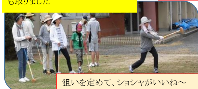
狙いを定めて、ショシヤがいいね～