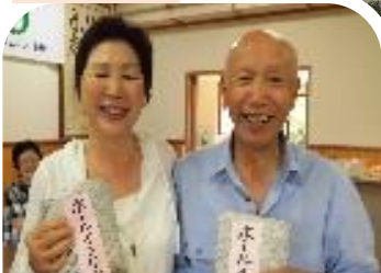
11班のご二人。ホールインワン賞も取りました