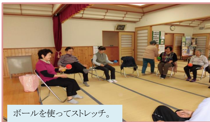
ボールを使ってストレッチ。

当時は、講師の指導でストレッチから始まり、鹿児島弁のラジオ体操で身体を動かしました。ひらがなカードを使ってのことば作りでは頭をつかいました。また、速さを競う新幹線ゲームは、真剣な取り組みながらもおいに笑えました。いつものことですが、出来ないことは笑いでカバーしています。後のお茶のみでも、おしゃべりで楽しそうでした。講師から『毎日、少しずつ、ひとつでも、テレビを見ながらでも、ストレッチを続けてください。』といわれ、分かってるけど、なかなか実行できないと笑って答えました(。)