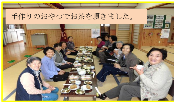
手作りのおやつでお茶を頂きました。