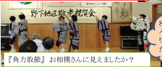
『角力取節』お相撲さんに見えましたか？