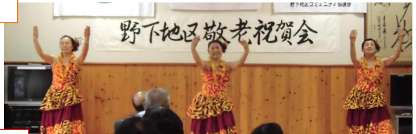
おはら節をフラダンスで踊れるのですね。かっこいい。