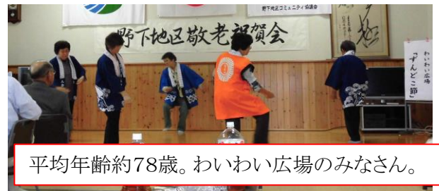
平均年齢約78歳。わいわい広場のみなさん。