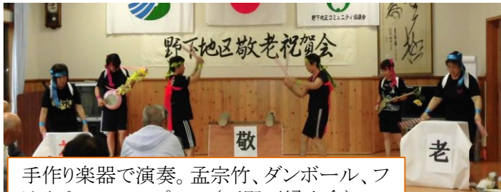
手作り楽器で演奏。孟宗竹、ダンボール、フライパン、スコップ……(下野下婦人会)

75歳以上の長寿の方を招待。お祝いの宴では、婦人会団体等の協力で、踊りや芸を披露して、華を添えてもらいました。また、マウナ・フラ春田教室の3名のフラダンスもあり、すてきなダンスに癒されました。皆さんご協力ありがとうございました。