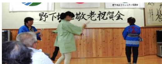
牛鼻婦人会の手具(竹)を使って踊るハンヤ節。