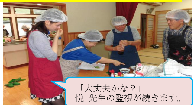
「大丈夫かな？」 悦先生の監視が続きます。