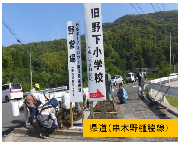
県道（串木野樋脇線）