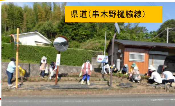
県道（串木野樋脇線）