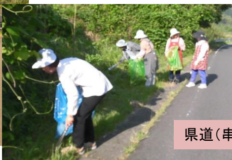
県道（串木野樋脇線）