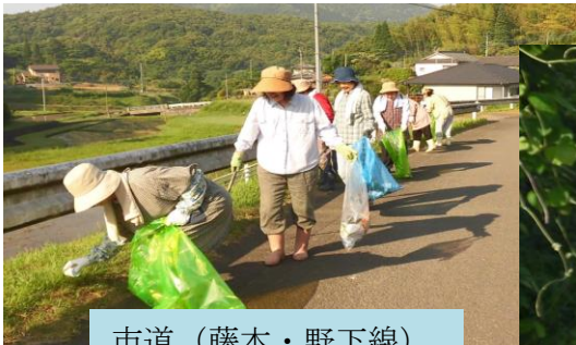
市道（藤本・野下線）

6月1日（日）7：00～ 好天気の中、道路清掃と花壇の手入れ（花苗の植え付け）を皆さんの協力で実施できました。きれいな花を通して『ごみのポイ捨てをしないように』通りゆくドライバーに訴えていきましょう。