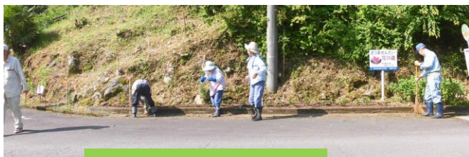
市道（藤本・野下線）