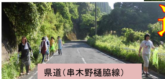
県道（串木野樋脇線）