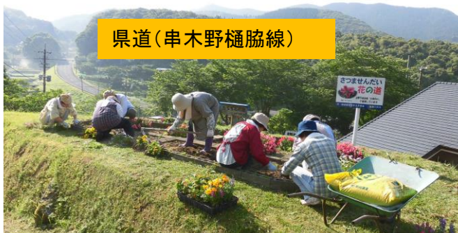
県道（串木野樋脇線）