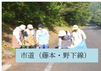
市道（藤本・野下線）