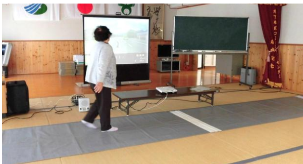
横断歩道の渡り方(走って来るスライドの車を見ながら..)