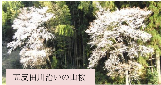
五反田川沿いの山桜