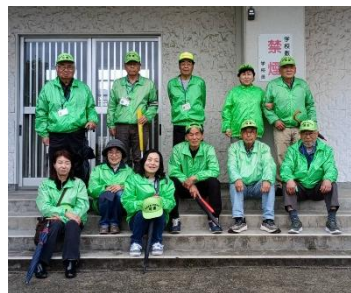
可愛地区民生委員の皆さん

4月26日(日)には、鯉のぼりフェスタを開催する予定で、地域のみなさんにぜひ足を運んで楽しんでほしい、と準備に取り掛かっておられます。