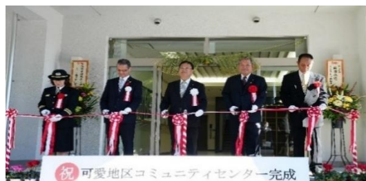
テープカットの様子（中央が市長）

市長式辞の中で、地域づくり生涯学習、文化活動など、交流の場として、大いに活用してくださいと、また、本施設が、地区コミュニティ協議会や自治会をはじめ地域の皆様のつな