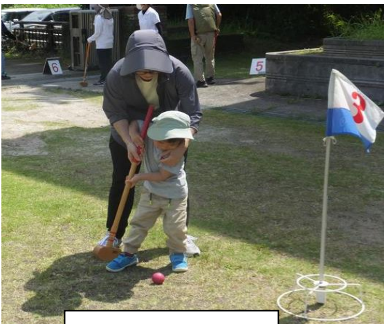
子どもと一緒にプレー