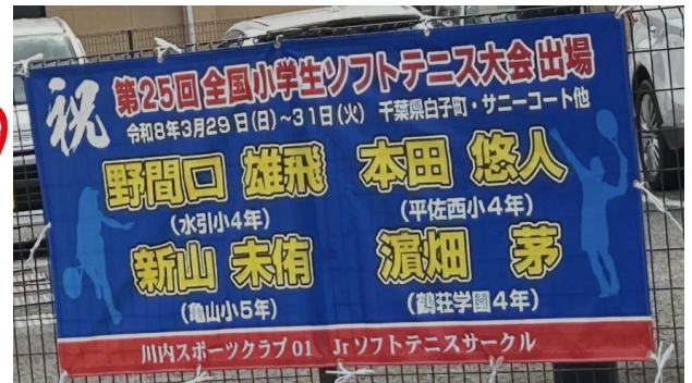
市内に掲示してある横断幕